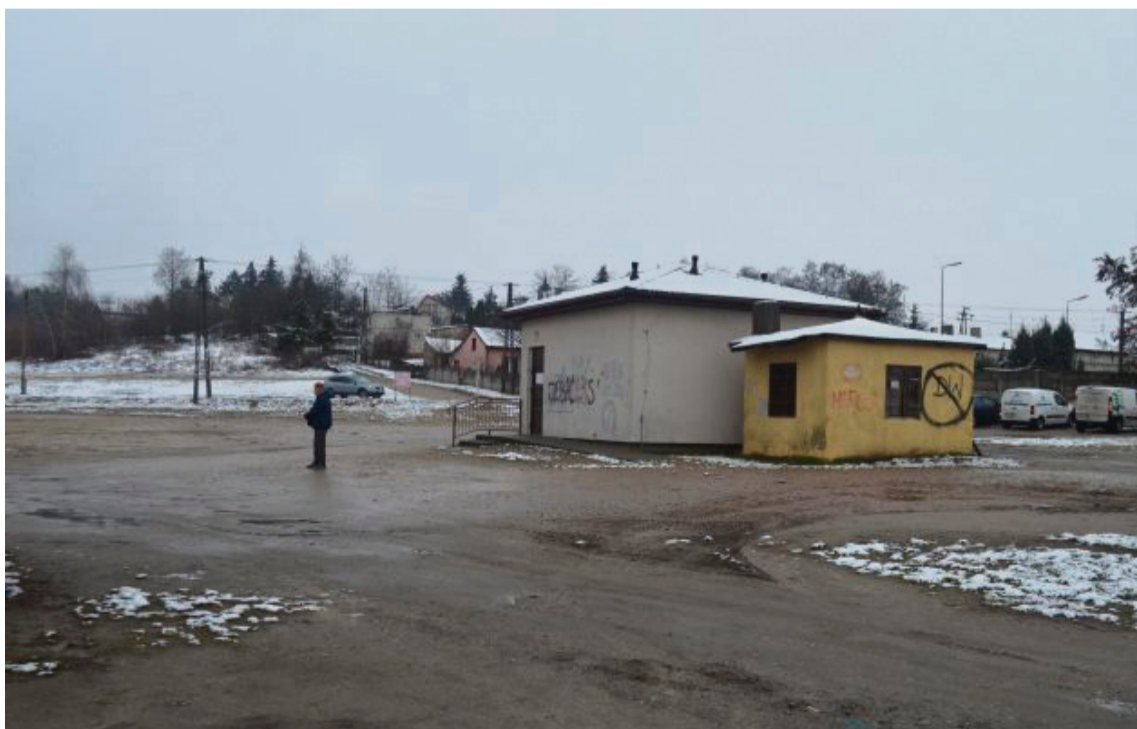
Tak obecnie wygląda fragment targowiska, który m.in. chcielibyśmy przebudować.